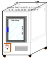
Câmara fria para congelamento rápido, ABP, Layout

Dispomos de uma linha padronizada de Câmaras frias para congelamento rápido , contado com equipamentos dimensionados para atingir a marca desejada em até 1 (uma) hora, de fácil operação e grande durabilidade.