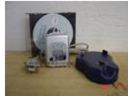
Aquisitor de dados e ou Data logger , modelo AQD/20.SI kit completo