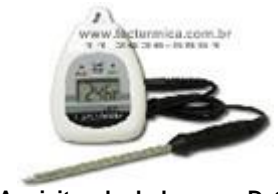
Aquisitor de dados e ou Data logger , modelo AQD/20.SE só o aparelho

Confira a seguir os modelos e as respectivas características técnicas, bem como os preços do Aquisitor de dados e ou Data logger para câmara fria , como segue: