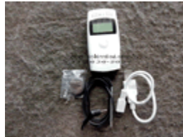
Aquisitor de dados e ou Data logger , modelo AQD/11.SE kit completo