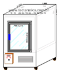
Câmara fria para congelamento rápido, ABP, Layout

Dispomos de uma linha padronizada de Câmaras frias para congelamento rápido , contado com equipamentos dimensionados para atingir a marca desejada em até 1 (uma) hora, de fácil operação e grande durabilidade.